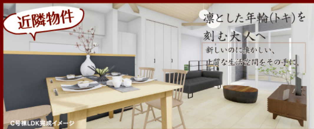
C号棟LDK完成イメージ